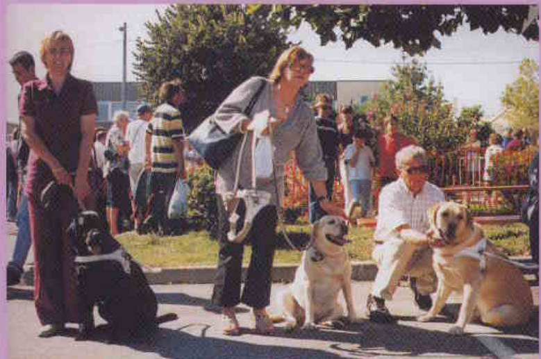
Journée portes ouvertes du 14 septembre 2002