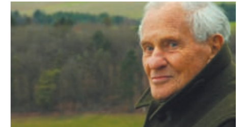
L'académicien Jean d'Ormesson